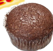
濃厚チョコ クリームパン 230円