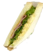
ハムチーズ卵サンド 280円