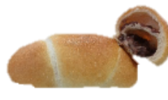
あん塩バターパン 150円