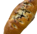
さつまいも塩バター パン 190円