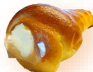
コロネ(カスタード) 180円