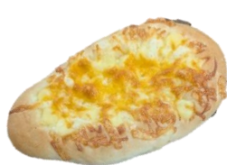
3種のチーズパン 180円