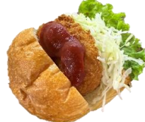
カニクリームコロッケ バーガー 280円