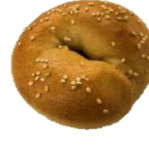
黒糖さつまいも クリーム 260円