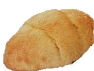
塩バター メロンパン 190円