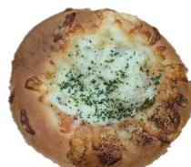
ゴロゴロジャガ明太 200円