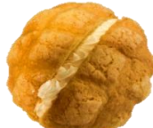
天使のホイップ 210円