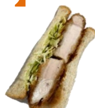
びっくりとんかつ サンド 340円