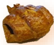
チョコクロワッサン 190円