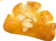
マシマシ クリームパン 180円