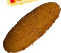
ビーフカレー パン 250円