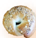
ゆず胡椒マヨ入り チーズ 230円