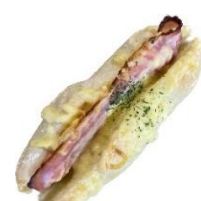
ベーコンポテトドッグ 280円