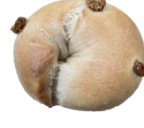
黒糖いちじく クリームチーズ 260円

○宮領本店 東広島市高屋町宮領178-2 OPEN 9:00-17:00 店休日: 日・月