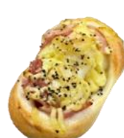
ゆずマヨチーズ ベーコンパン 200円