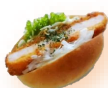
えびカツバーガー 320円