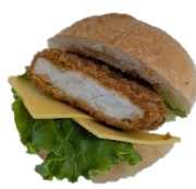
オーロラソースチキン カツバーガー 270円