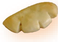
アップルカスタード 230円