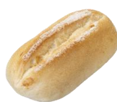
練乳バターパン 130円