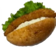
タルタルフィッシュ バーガー 260円