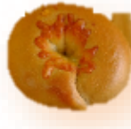
黒糖くるみクリーム チーズ 250円