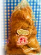
ミニクロワッサン (5個入り) 200円