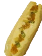
フルーツサンド 300円