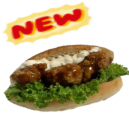
チキン南蛮バーガー 350円