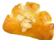
マシマシ クリームパン 200円