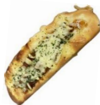
照り焼きチキンドッグ 280円