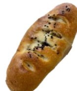
さつまいも塩バター パン 200円