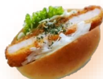
えびカツバーガー 340円