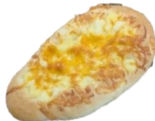
3種のチーズパン 200円