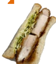
びっくりとんかつ サンド 380円