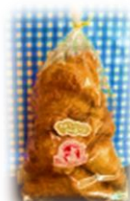
ミニクロワッサン (5個入り) 220円