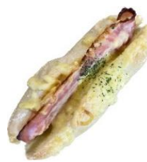
ベーコンポテトドッグ 300円