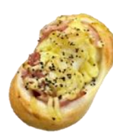
ゆずマヨチーズ ベーコンパン 220円