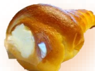
コロネ(カスタード) 200円