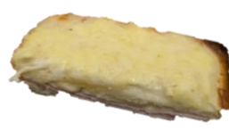
クロックムッシュ 250円