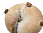
黒糖いちじく クリームチーズ 280円

○宮領本店 東広島市高屋町宮領178-2 OPEN 9:00-17:00 店休日: 日・月