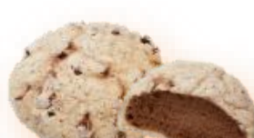
チョコチップココア メロンパン 200円