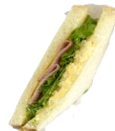
ハムチーズ卵サンド 300円