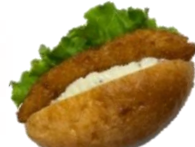
タルタルフィッシュ バーガー 280円