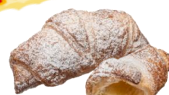
チーズケーキ クロワッサン 240円