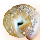
ゆず胡椒マヨ入り チーズ 250円