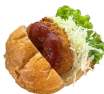
カニクリームコロッケ バーガー 300円