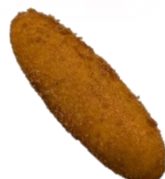
ビーフカレー パン 280円