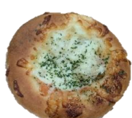
ゴロゴロジャガ明太 230円