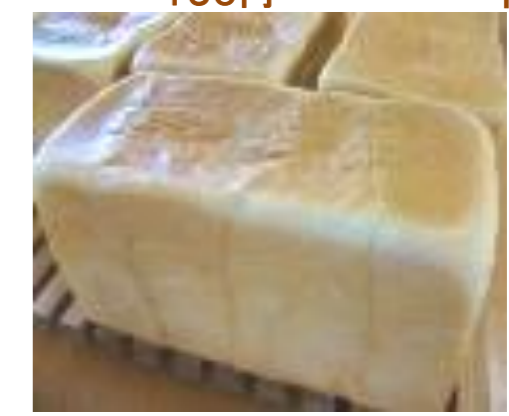
絹生食パン 1斤 260円 (写真は2斤分です)